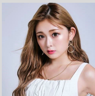
タレント・モデル ゆうちゃみ 氏