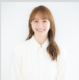
タレント 藤本 美貴 氏

経済・教育・エンタメからの視点で、地域資源の再発掘と新たな価値創出に焦点を当て、地域の潜在力を最大化するための新たな気づきを提供します。持続可能な地域ブランド確立に向けた戦略を探るフォーラムです。