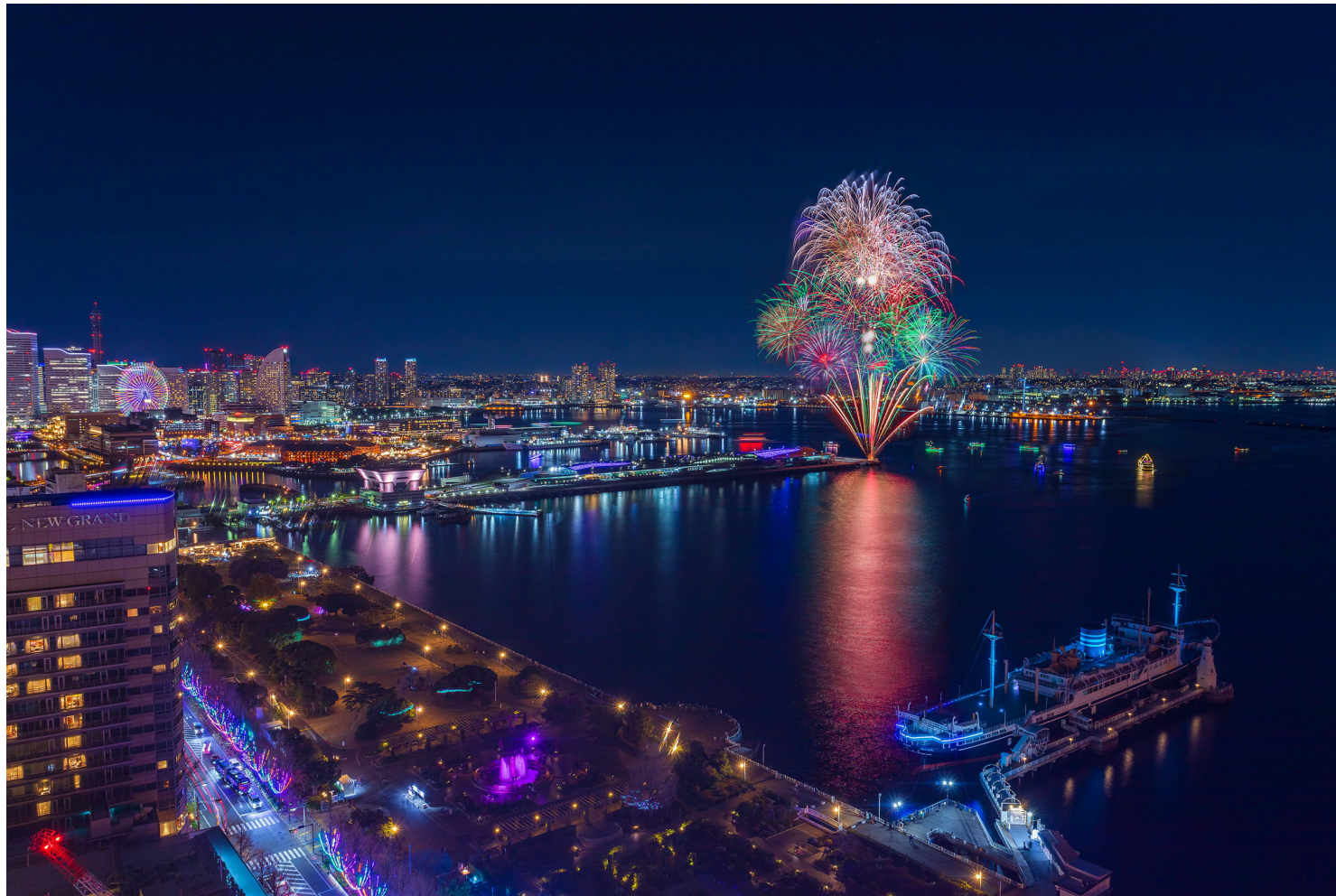
横浜スパークリングトワイライト