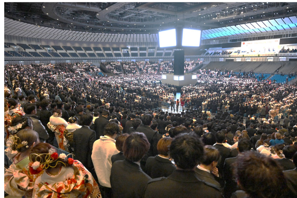
昨年度式典の様子

平成16年4月2日から平成17年4月1日までに生まれた、市内に住民登録をされている方 約35,000人