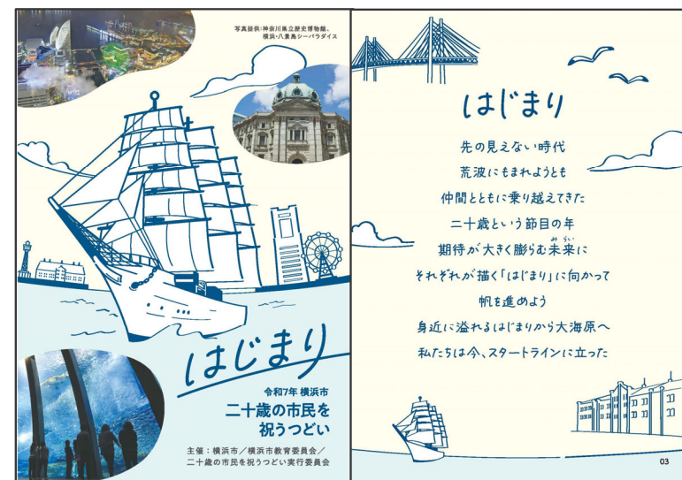
作成中の記念冊子