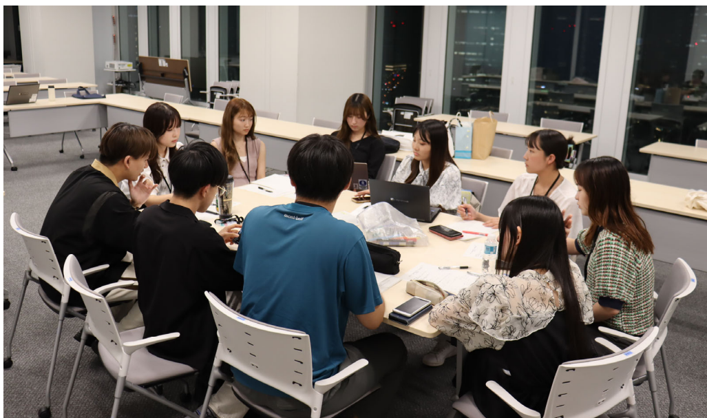
実行委員会の様子

公募により、 10名 の二十歳の市民の方々に構成、 今年の 5月 から活動を開始