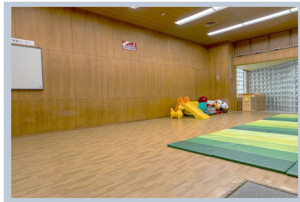
【金沢地区センターのプレイルーム】