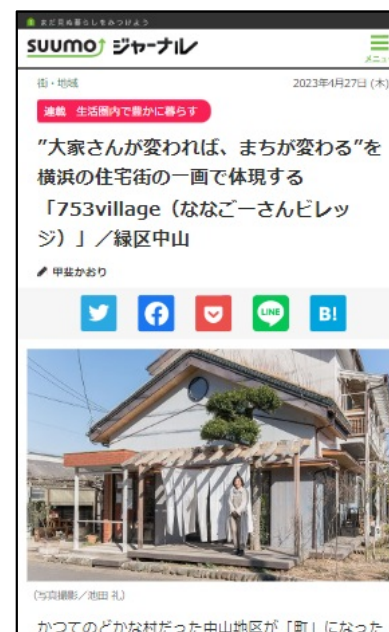
地域コミュニティに関する紹介記事