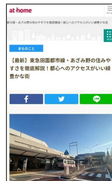
居住者の声を交えた街の紹介記事