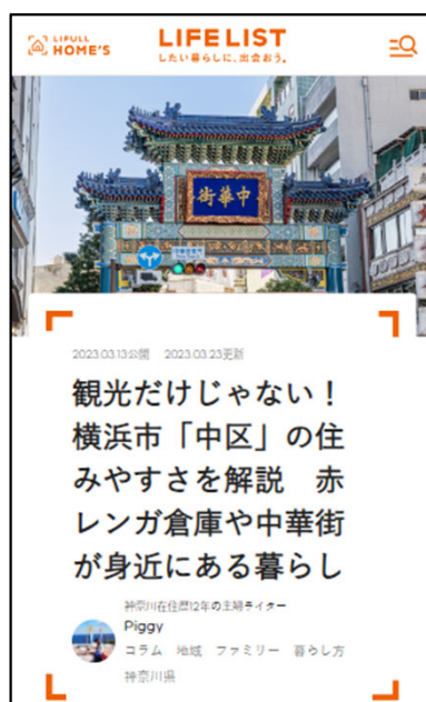
実体験を踏まえた街の紹介記事