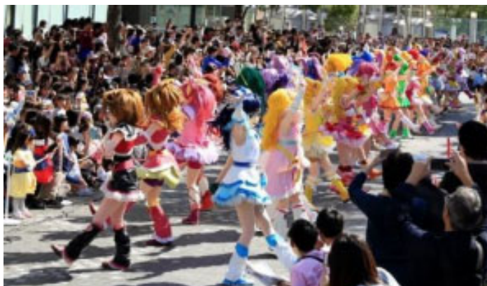
全プリキュアパレード (2018年)