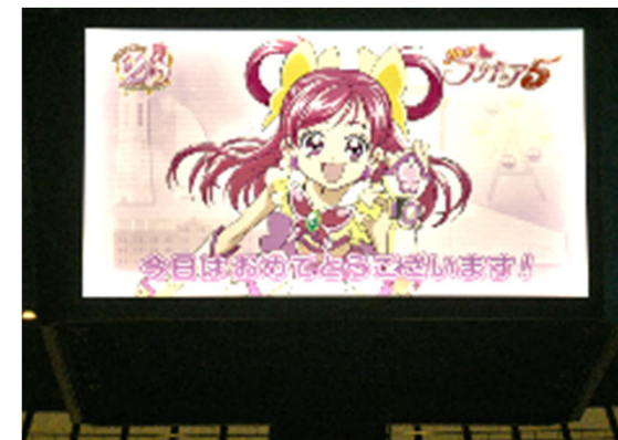
「二十歳の市民を祝うつどい」 に出演 (2023年)