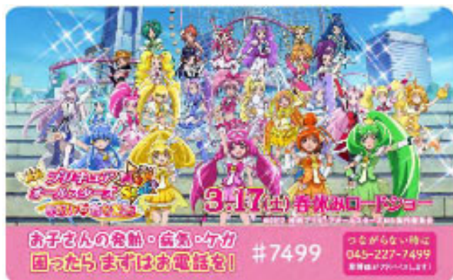
小児救急電話相談ダイヤルPR カード (2012年)

2012年に横浜の街が映画の舞台となったことを契機に、小児救急電話相談ダイヤルのPRや、パレードの開催など、様々な施策で継続的に連携してきました。