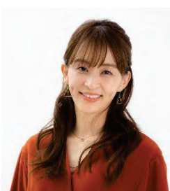
たなか りえ 田中 理恵さん (元体操選手・オリンピック) みなとみらい7km ラン参加