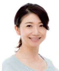
いちはし あり 市橋 有里さん (シドニー五輪元女子マラソン日本代表) みなとみらい7km ラン参加