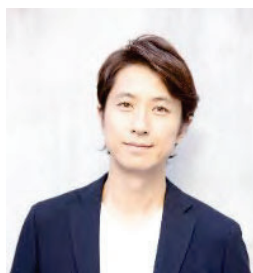
たにはら しょうすけ 谷原 章介 さん (俳優) みなとみらい7km ラン参加