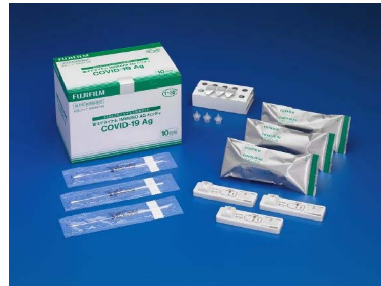
配布用抗原検査キット