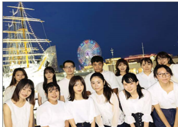
市内在住の新成人で構成される 「横浜市『成人の日』記念行事実行委員会」 がテーマを決定