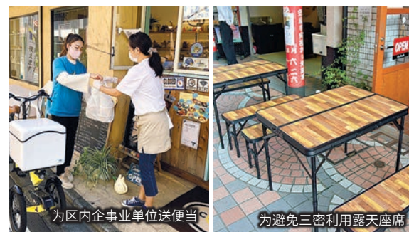
为区内企事业单位送便当

不仅公司内部的防疫对策，「支援育儿和工作两不误」及「创造良好的工作环境」也取得了良好的效果。