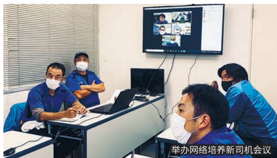
举办网络培养新司机会议

它拥有AI面部认证功能，考虑到面部汗水及周边环境，实现了高精度的非接触测温。同时，还可以进行非接触手指消毒。