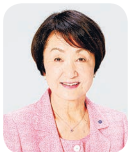
横滨市长 林 文子

今年冬天，除了要预防新冠病毒感染以外，还要特别注意流行性感冒。本年度65岁以上的市民可以免费打流感预防针。请大家积极配合。希望市民们做好预防流感准备，饮食中多加入高营养价值的时令蔬菜等，健康愉快地度过美好的秋天。