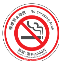
路上有这个标识的地方