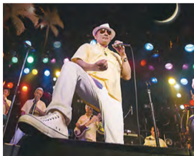
▲ CRAZY KEN BAND

2009年纪念横滨开港150周年举办的“开国·开港博览会Y150”距今已经过了十年。我们朝向纪念横滨开港200周年,举行各种各样的活动。