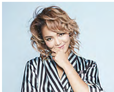
▲ Crystal Kay