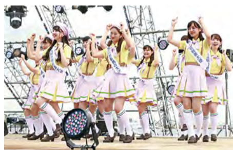
▲横滨姑娘☆特设舞台