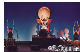
▲ 林英哲特别公演(示意图)

联络地址 实行委员会 电话: 045-663-1365 传真: 045-663-1928