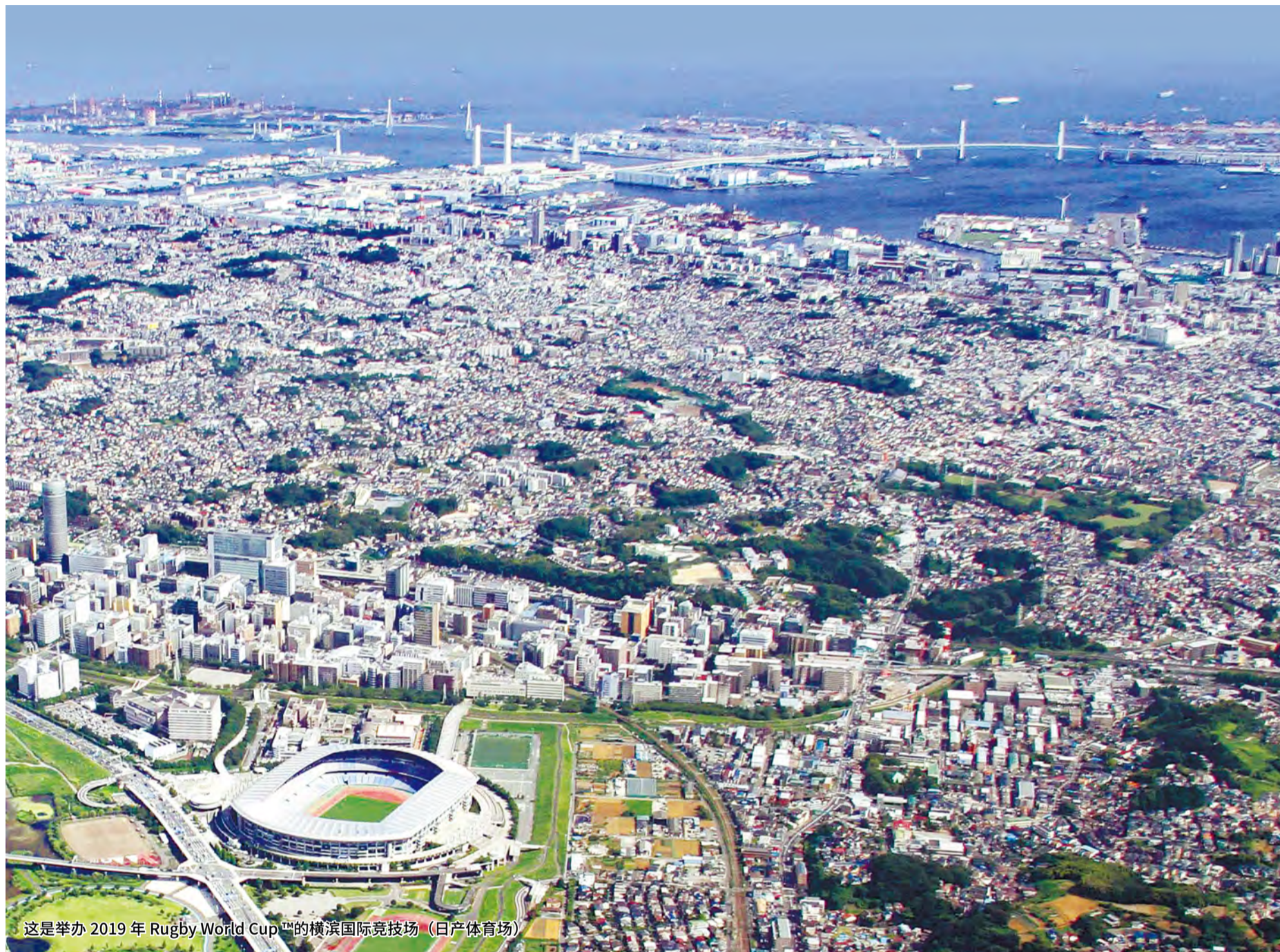
这是举办 2019 年 Rugby World Cup 的横滨国际竞技场（日产体育场）