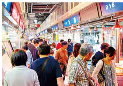
可以购买新鲜的鱼类贝类等