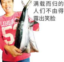
满载而归的人们不由得露出笑脸