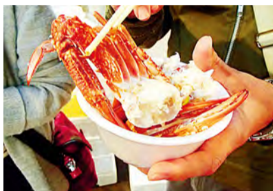
大量使用市场的时令食材

向来场人士免费发送的鱼河岸汤汁。根据举办日期不同，材料种类也有变化，使用什么样的材料，值得期待。