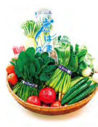
在近郊收获的新鲜蔬菜