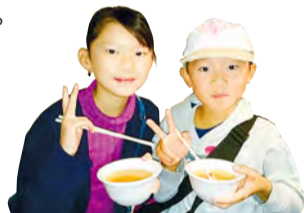
因美味可口而大为满意

向来场人士免费发送的鱼河岸汤汁。根据举办日期不同，材料种类也有变化，使用什么样的材料，值得期待。