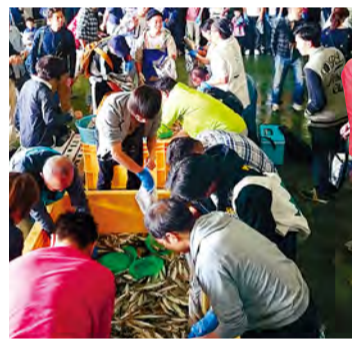
将本港鱼装满袋子

这是本港鱼不限量装袋优惠活动，产品是在平塚港等横滨附近的渔港捕捞上岸的新鲜的本港鱼类。这绝对可以算是产地消。根据大海的状态不同，到货的鱼类种类也有变化，这也是值得一大乐趣。