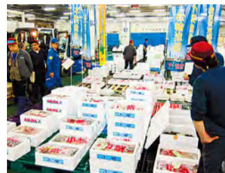
经销神奈川县内的渔港捕捞上岸的本港鱼类

大力推进产地消活动，包括在相模湾和东京湾等地刚刚捕捞上来的近海鱼类，同时还包括横滨蔬菜和湘南蔬菜等市内和县内的蔬菜的揽货与批发。