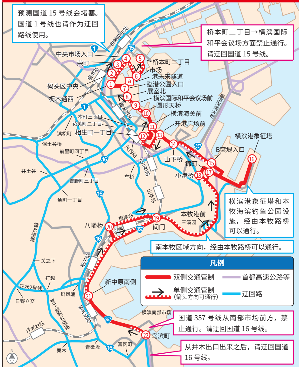
在大赛中实施交通管制的一般道路管制时间