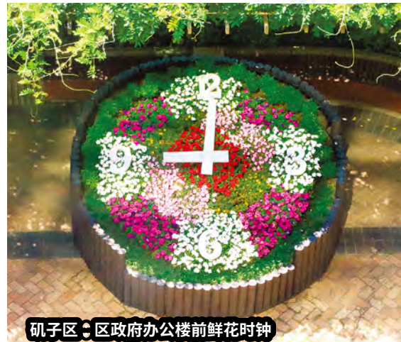
矶子区：区政府办公楼前鲜花时钟