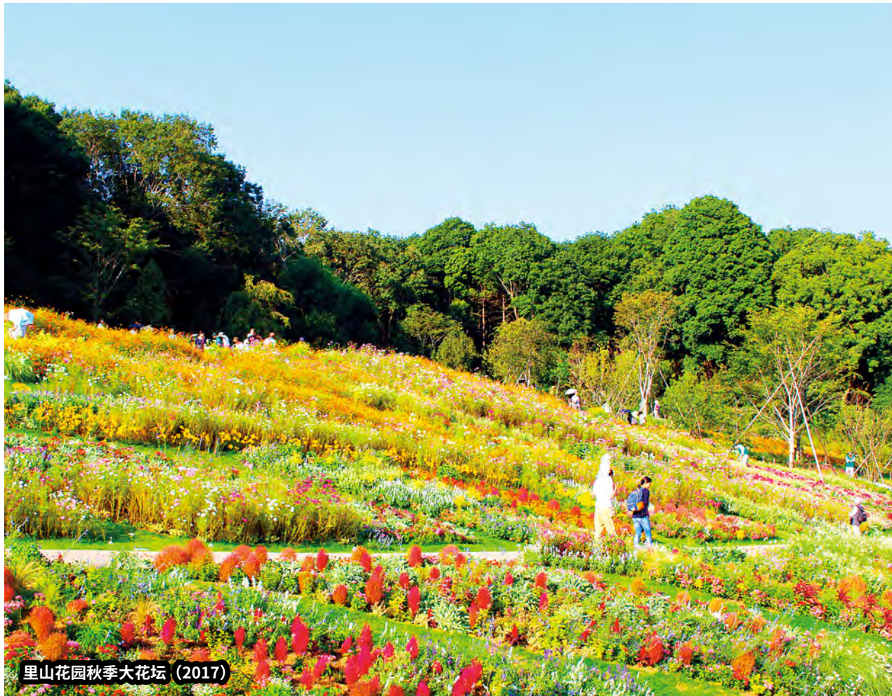
里山花园秋季大花坛 (2017)