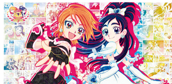
PRECURE 15th ANNIVERSARY!