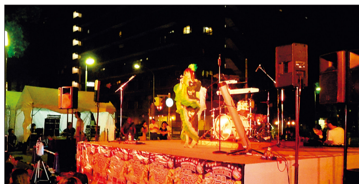
以往舞台活动的情形