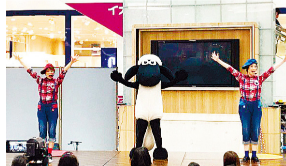
④ 小羊肖恩舞台 (示意图)