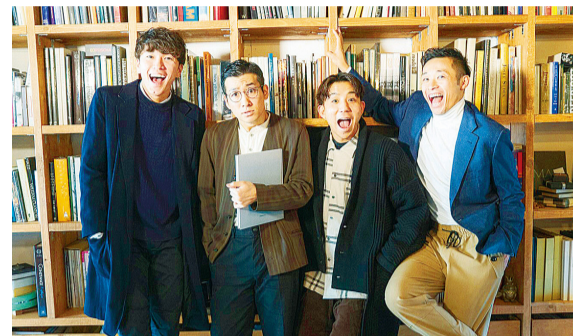
① s**t kingz