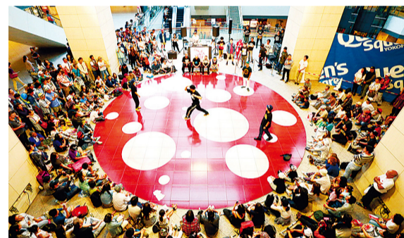
② BATTLE DELIGHT -ALL STYLE SOLO BATTLE-