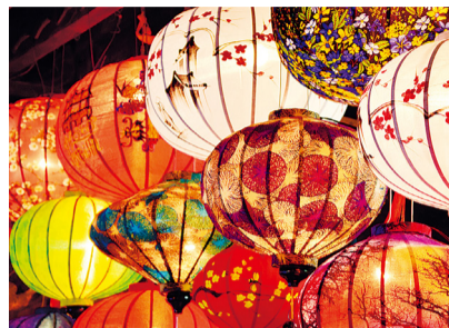
装点夜晚的“Zoorasia 夜市”（示意图）