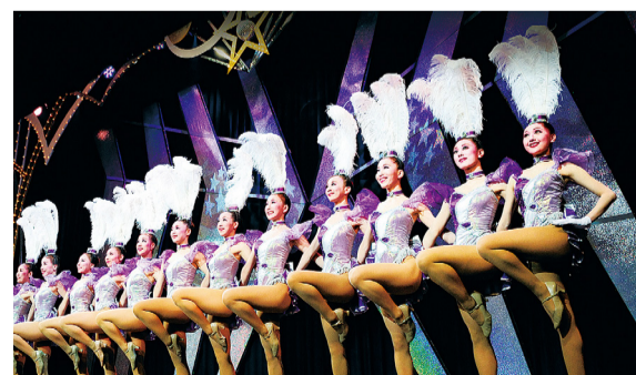
⑤ OSK 日本歌剧团 (示意图)