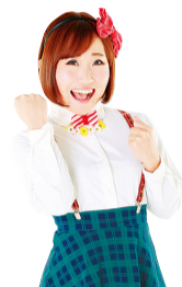
金太郎。女士 参加闭幕式特别 节目！

9月30日是Dance Dance Dance @ YOKOHAMA 2018的最后一天，在这一天里，参加舞蹈乐园的全体舞蹈演员和观众汇聚一堂，大家一同演绎原创舞蹈“Red Shoes”，我们将以此形式举办一场规模浩大的闭幕式。