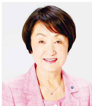
横滨市长 林 文子