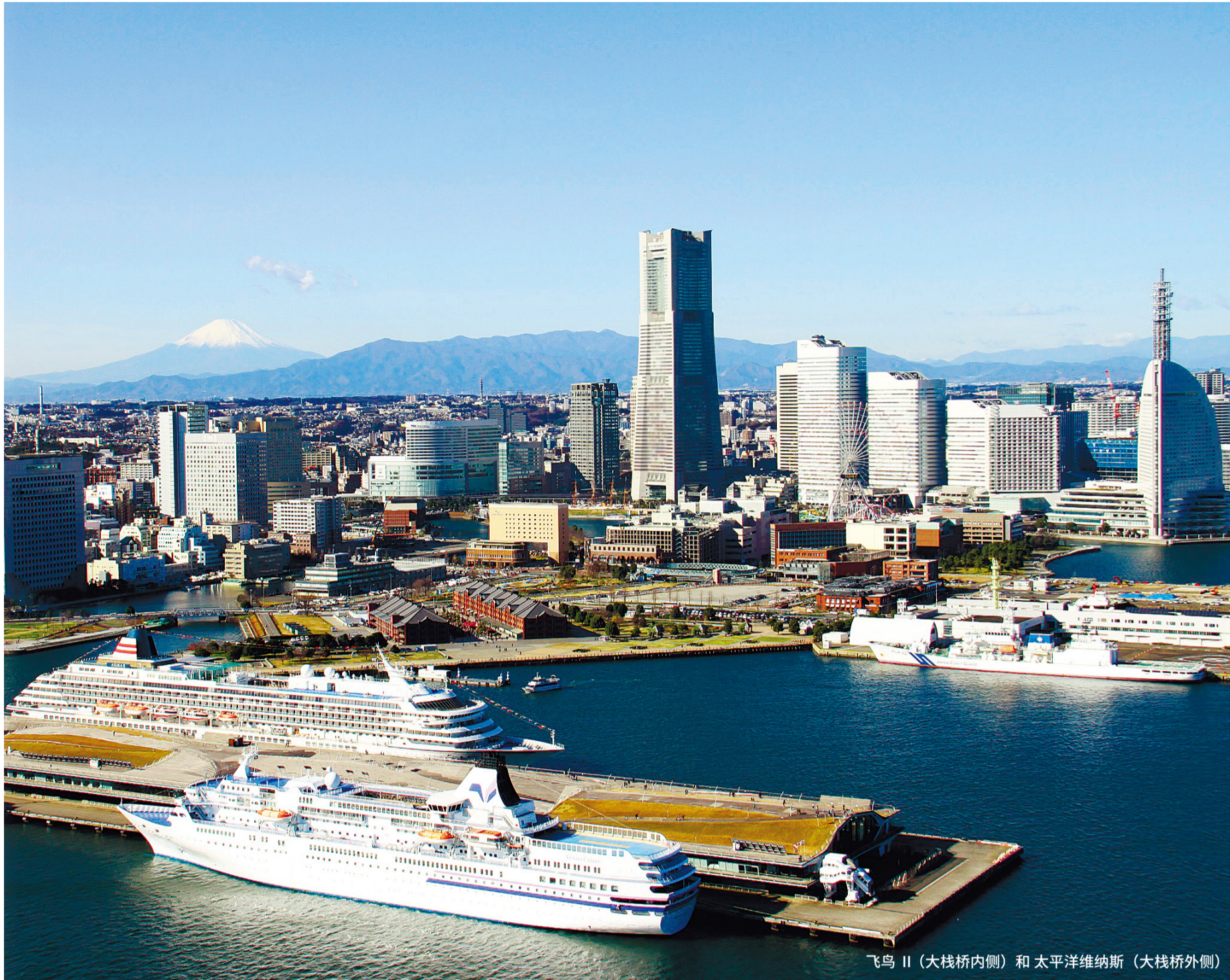
飞鸟 II (大栈桥内侧) 和 太平洋维纳斯 (大栈桥外侧)