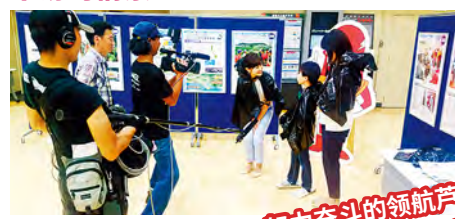
用垃圾袋制作简单雨衣