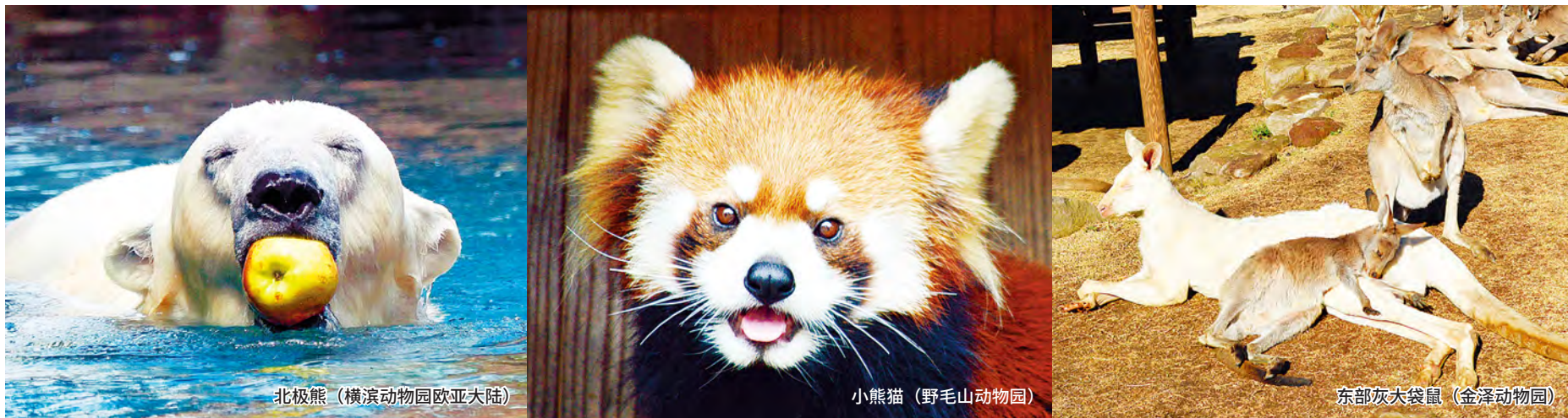
北极熊 (横滨动物园欧亚大陆)