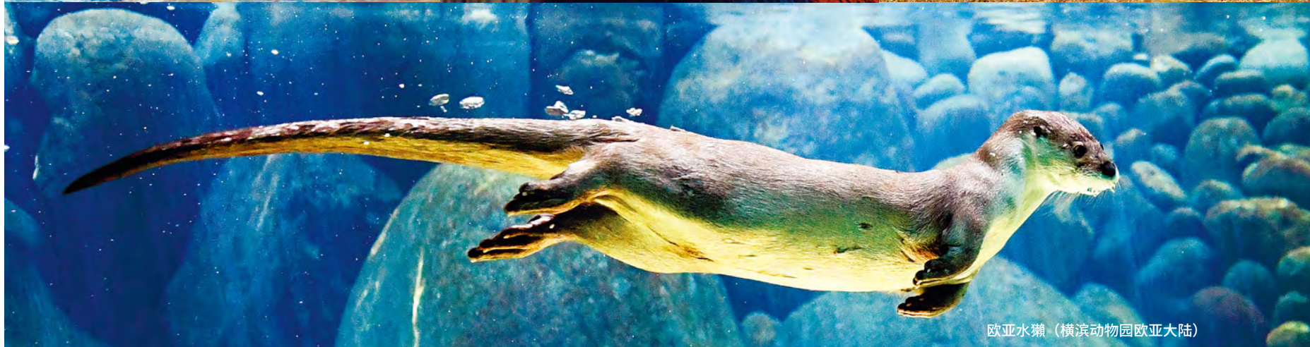
欧亚水獭 (横滨动物园欧亚大陆)