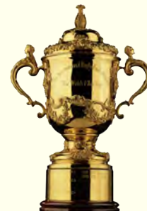
TM © Rugby World Cup Limited 1986. All rights reserved.

此外,套票自1月19日(周五),普通票自2月19日(周一)以JRFU会员俱乐部, Sunwolves官方粉丝俱乐部会员等为对象实施先行抽签销售。