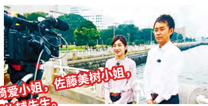
在山下公园拍摄片头景