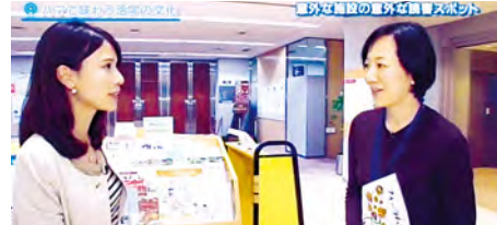
介绍男女共同参与中心横滨的信息图书馆