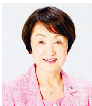
橫濱市長 林 文子

一到每週三和週五的中午，市政府大廈1樓的市民廣場上會出現排隊人群，可以聽到精神抖擻的聲音「歡迎光臨」。這裡正在舉辦「我是城市的麵包房」活動，銷售殘疾人士創作的麵包和曲奇等商品。「希望傳遞美味可口的食品」，每塊麵包都包含著這樣的心意，這些麵包真的具有非常醇厚的口感，有不少常客每次都慕名而來。將購買麵包用的托盤交給客人，將購買的商品裝進購物袋，銷售自己創作的麵包，所有的人表情都是那樣神采飛揚。