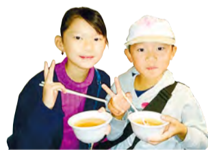
Fragrância que satisfaz a todos

Generosa utilização de ingredientes sazonais do mercado. Uma tigela de sopa de frutos do mar ("uogashi") é oferecida a todos os visitantes. Parte da diversão de visitar o mercado é ver quais ingredientes são usados no ensopado, visto que dependem do dia em questão.