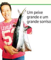
Um peixe grande e um grande sorriso

*Sujeito a cancelamento em caso de mau tempo.