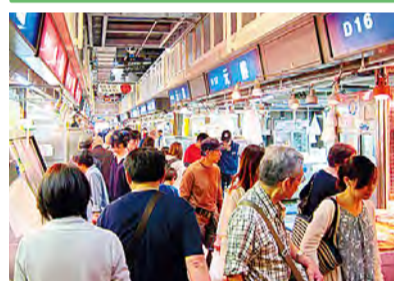
Os visitantes podem também comprar outros produtos além de frutos do mar.