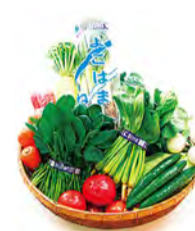
Vegetais frescos colhidos na área de Yokohama