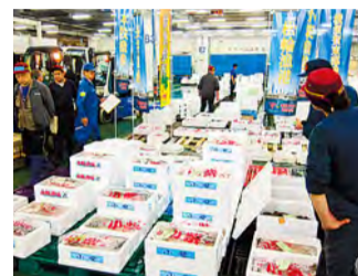
Manejo de peixes desembarcados nos portos da província de Kanagawa

O Mercado Atacadista Central de Yokohama promove a produção local para o consumo local. Para tanto, está trabalhando para amearhar e vender por atacado peixes pescados nas águas circunvizinhas, tais como nas baías de Sagami e Tóquio, além de vegetais produzidos em Yokohama e outras partes da província de Kanagawa, incluindo vegetais produzidos em Yokohama e Shonan.