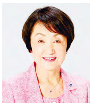
Fumiko Hayashi Prefeita de Yokohama

O Mercado Atacadista Central de Yokohama, a verdadeira cozinha da cidade, localiza-se na parte central da zona Minato Mirai, a apenas 20 minutos a pé da estação de Yokohama. Ali encontra-se frutas e vegetais produzidos em Yokohama, peixe pescado nas redondezas, e todos os tipos de comida perecível do Japão e outros países de todo o mundo. Peixes frescos pescados pela manhã nas águas das imediações (chamado de “okkake”) são leiloados aqui e despachados às peixarias e restaurantes no mesmo dia, como só um mercado como o de Yokohama poderia fazer.