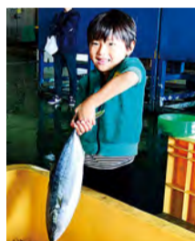
As crianças também se divertem muito.