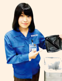
Botar la basura en los basureros.