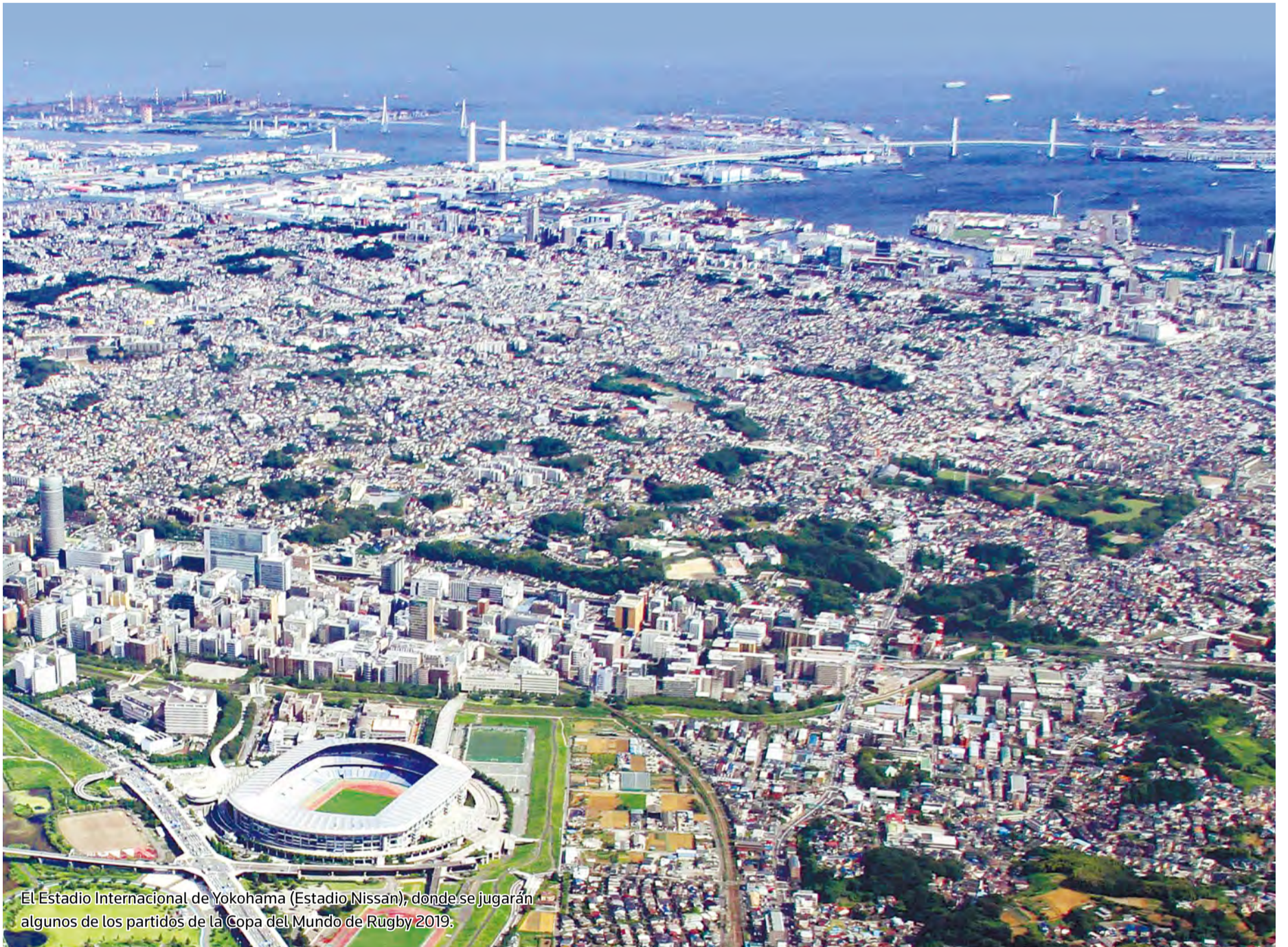
El Estadio Internacional de Yokohama (Estadio Nissan), donde se jugarán algunos de los partidos de la Copa del Mundo de Rugby 2019.