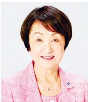
Fumiko Hayashi Alcaldesa de Yokohama

¡Feliz Año Nuevo para todos! Sinceramente espero que tengan un nuevo año con seguridad y buena salud. Este año Yokohama celebrará el 160º aniversario de la inauguración de su puerto y realizará una serie de eventos que elevarán aún más la estatura de Yokohama como ciudad internacional. Estamos determinados en hacer del 2019 un año fructífero en el cual Yokohama dará otro salto, con la colaboración de todos ustedes.