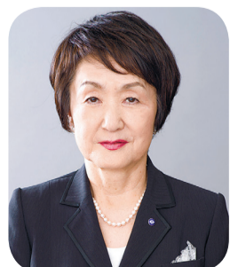
요코하마 시장 하야시 후미코

1월 말에 총액 2조 73억 엔의 2021년도 예산안을 발표했습니다. 전례 없는 어려운 재정 상황 속에서 어떻게든 시민 여러분의 생명과 생활을 지키고 경제를 힘차게 활성화시켜서 요코하마의 미래 성장으로 연결해 나가겠다는 그런 마음을 담아 이번 예산을 편성했습니다.