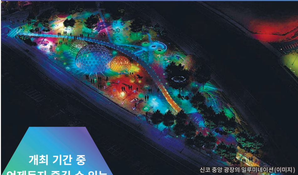
신코 중앙 광장의 일루미네이션(이미지)

개최일 12월 26일(토)까지 매일 18시~21시 05분 장소 신코 중앙 광장과 주변 지역 비용 무료