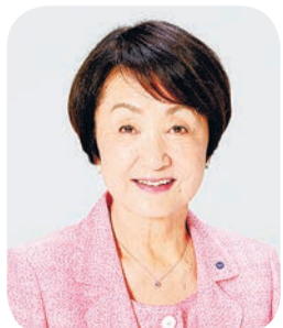
요코하마 시장 야마시 후미코

코로나 재난 속에서 요코하마시는 세계에 앞장서서 현대 아트 국제 전시회 '요코하마 트리엔날레 2020'을 개최했습니다. 또한 요코하마의 가을 꽃들이 한창 피는 '가을의 사토야마 가든 페스타'는 사상 최대의 방문객 수를 달성했습니다. 그리고 현재, 밤의 요코하마를 아름다운 illumination으로 수놓는 '요루노요'를 실시하고 있으며, 이달 10일부터는 프랑스 영화제도 시작됩니다. 문화 예술과 자연, 아름다운 풍경에는 사람의 마음을 치유하고 용기와 희망을 선사해 주는 큰 힘이 있습니다. 부디 많은 분들이 즐겨 주셨으면 합니다.