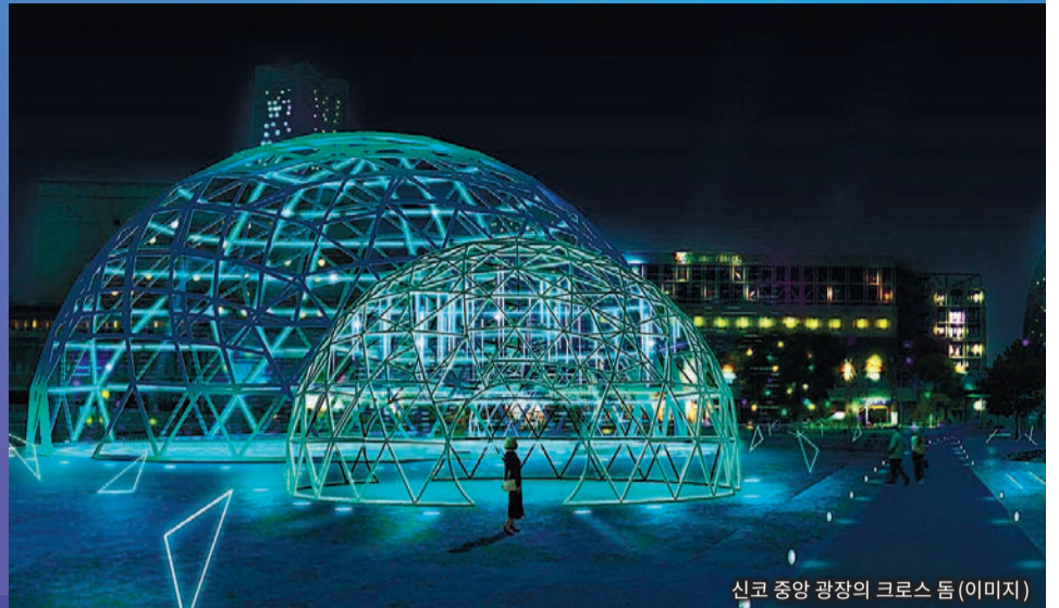
신코 중앙 광장의 크로스 돔(이미지)