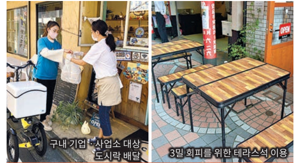
구내 기업 · 사업소 대상 도시락 배달

사내의 감염증 예방 대책과 아울러 ‘육아와 일의 양립 지원’ 및 ‘일하기 쉬운 직장 환경 만들기’의 효과도 얻을 수 있습니다.