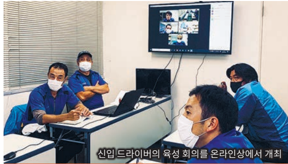
신입 드라이버의 육성 회의를 온라인상에서 개최

AI 안면 인식 기능을 탑재하여 표면의 땀이나 주변 환경을 고려하여 접촉 없이 정밀도가 높은 체온 측정을 할 수 있으며 동시에 비접촉 손 소독도 가능합니다.