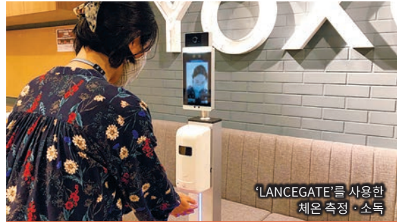
‘LANCEGATE’를 사용한 체온 측정 · 소독

신종 코로나 바이러스 감염증의 영향이 장기화할 것으로 예상되는 가운데 시내 사업자나 개인 사업자 등에서는 ‘새로운 생활 양식’에 대응한 다양한 활동이 이루어지고 있습니다. 우리 시에서는 사업자 여러분들의 활동을 동영상, SNS, 책자 등으로 발신하여 시민 여러분들과 함께 응원해 나갑니다. 또한 사업자 여러분들의 활동도 모집하고 있습니다. 자세한 내용은 웹사이트를 확인해 주십시오.