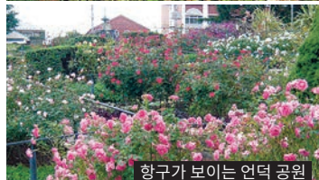
항구가 보이는 언덕 공원