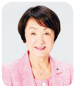
요코하마 시장 야마시 후미코

요코하마시는 시민 여러분의 생명과 생활을 지키기 위해 앞으로도 전력을 다하겠습니다. 재해는 언제 발생할지 알 수 없습니다. 여러분도 자신과 소중한 사람의 생명을 지키기 위해 해저드 맵에서 주택 부근의 위험 장소나 대피 경로를 확인하고 대피 시의 반출품을 준비·확인하는 등 평상시부터 대비해 주시기를 부탁드립니다.