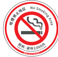
이 마크의 노면 표시로 알 수 있습니다