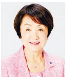
요코하마 시장 하야시 후미코

일본 최대 규모의 음악 페스티벌 ‘요코하마 오토마츠리’는 3년만에 세 번째로 개최되었습니다. 11월 15일까지 2개월에 걸쳐 요코하마의 ‘거리’ 그 자체를 무대로 하여 프로부터 아마추어까지 다양한 분이 300개가 넘는 프로그램을 전개하여 거리에 음악이 넘치고 있습니다.