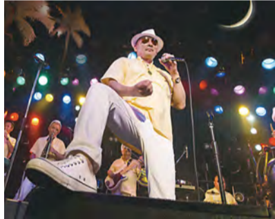
▲ CRAZY KEN BAND

5월 3일(금·공휴일)~6월 2일(일)은 '요코하마 개항 월간'. 야마시타 공원을 중심으로 요코하마 특유의 국제 색이 풍부한 이벤트가 '요코하마 센트럴 타운 페스티벌 "Y160"'을 메인 이벤트로 하여 다수 개최됩니다. 이벤트에 참가하여 요코하마 개항 월간을 함께 즐기세요!