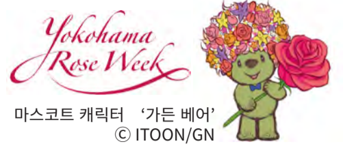
마스코트 캐릭터 '가든 베어'

올해는 개항 이래 요코하마 시민에게 사랑받아 온 장미를 주역으로 한 새로운 이벤트 '요코하마 로즈 위크' 를 개최합니다. 메인 이벤트인 '장미 페스타 2019' 를 비롯한 다양한 이벤트를 요코하마 개항 월간과 같은 시기에 개최하여 개항 160 주년의 요코하마를 물들입니다. 개최 기간 동안 개항의 역사가 느껴지는 항구의 풍경을 둘러보면서 장미를 즐길 수 있을 뿐만 아니라 장미를 테마로 한 디저트 등도 즐길 수 있습니다.