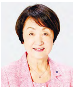
요코하마 시장 하야시 후미코

요코하마의 초여름 풍물시라고도 할 수 있는 대이벤트 요코하마 개항 축제. 개항 160년을 맞이하는 올해는 시민과 기업, 단체 여러분들과 함께 성대하게 축하하고 싶습니다.