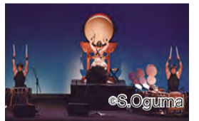
▲하야시 에이테츠 특별 공연 (이미지)

문의 실행위원회 전화 : 045-663-1365 팩스 : 045-663-1928