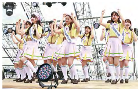
▲ 하맛코☆스페셜 스테이지