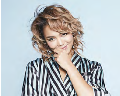
▲ Crystal Kay