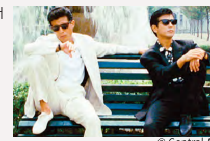
‘아부나이 데카’ 요코하마 로케이션 촬영지 MAP 3월 31일 (일) 까지 닛폰 TV 플러스 홈페이지에서 인쇄용 PDF를 공개 중.

제 50화 ‘저격’ 에서 벤치에 앉아 있는 장면은 요코하마 공원의 분수 앞에서 촬영되었습니다.