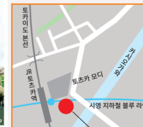
토츠카역 동쪽 출구 보행자 전용 통로