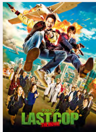
© 2017 영화 'ラスト 컵' 제작 위원회