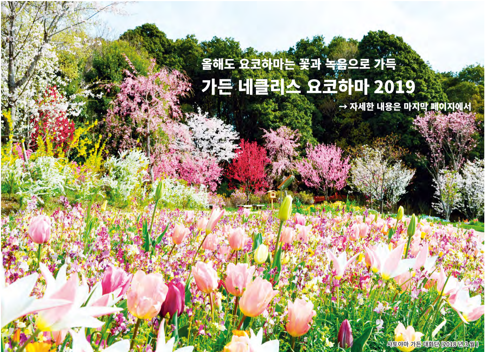
사토야마 가든 대화단 (2018년 3월)