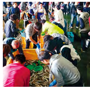
대물을 가득 담고 무심코 미소가 흘러 나온다

봉투 가득 근해 생선을 담는다 히라츠카항 등 요코하마 부근의 어항에 입하된 신선한 근해 생선을 무제한 담기. 이것이 바로 지산 지소. 바다의 상태에 따라 입하되는 어종이 바뀌는 것도 묘미 중 하나.