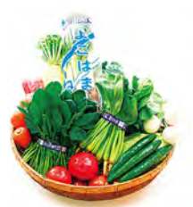
근교에서 수확한 신선한 야채