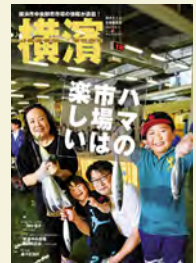
정가 610 엔

현내·도내의 서점 등에서 판매 중. 시청 시민 정보 센터에서는 지난 호도 취급하고 있습니다.