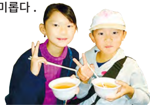
뛰어난 맛에 대만족

시장의 제철 식재료를 아낌없이 사용 방문객에게 무료로 제공되는 어시장 국물 요리. 개최일에 따라 들어가는 재료가 다르므로 어떤 재료로 만들어질지 흥미롭다.