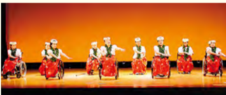
발표회는 정말 즐겁습니다

"Nanipuameria"의 홀라 댄서는 경험, 장애의 종류, 장애 정도 등 모두 다양합니다. 홀라 댄스는 장애가 있어도 즐길 수 있습니다. 저희와 함께 춤추지 않겠습니까?