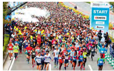
요코하마 마라톤 2016

또한 10월 26일 (금)~28일 (일)의 3일간은 붉은 벽돌 창고 이벤트 광장에서 '요코하마 마라톤 EXPO 2018'도 개최합니다. 스테이지와 부스 전시가 다양하므로 부담 없이 많이 방문해 주십시오!