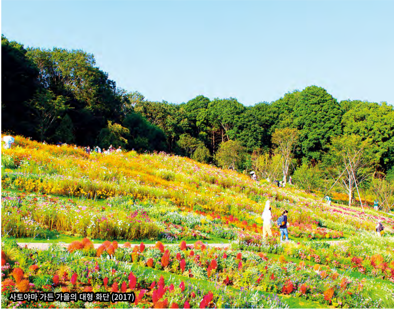
사토야마 가든 가을의 대형 화단 (2017)