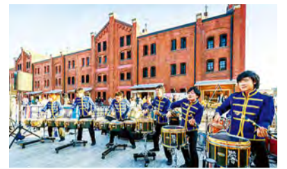
요코하마 마라톤 EXPO 2017