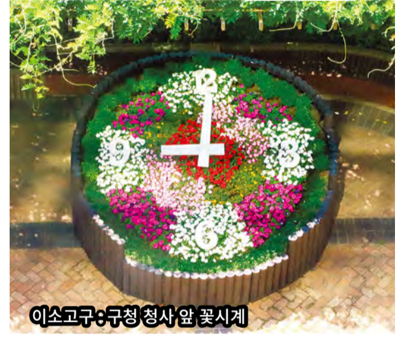
이소고구:구청 청사앞 꽃시계