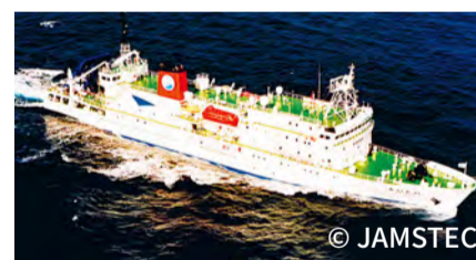
즐겁게 배울 수 있는 기획이 가득