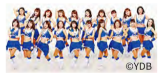
강사로 요코하마 DeNA 베이스타즈 오피셜 퍼포먼스 팀 diana (디아나)도 등장

[신청에 관한 문의는] 실행위원회 (문화관광국 내) 전화 : 045-663-1365 팩스 : 045-663-1928