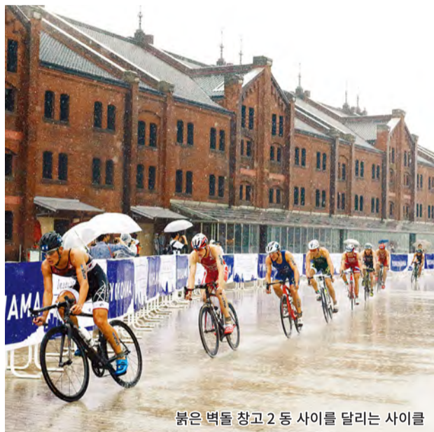
붉은 벽돌 창고 2동 사이를 달리는 사이클

13일(일) 에이지 그룹 (스탠더드 · 스프린트 · 릴레이 · 장애인 철인 3종 경기) : 7시 15분 ~ 14시