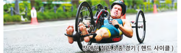
장애인 철인 3종 경기 (핸드 사이클)