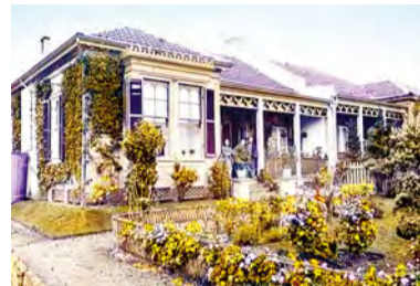
당시의 야마테 서양관의 모습

· 서양 장미는 1868 년에 야마테의 식물상 크레머에 의해 도입되었습니다. · 이후 요코하마와 도쿄의 식물상이 보급에 힘을 기울여, 정치가와 고위 관리 등을 시작으로 점차 재배되기 시작했습니다.