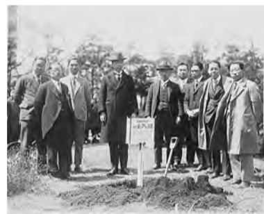
시애틀의 장미 식수 모습 (시역사 자료실 소장)

· 1923 년의 관동 대지진으로 큰 피해를 입은 요코하마에 미국 시애틀의 일본인회에서 원조 물자가 도착했습니다. · 우리 시는 그 답례로 석등롱을 보냈으며, 시애틀에서는 다시 장미 모종을 우리 시에 보내 왔습니다. 친선의 증표인 시애틀의 장미는 야마시타 공원과 노게야마 공원 등에서 증식되어, 그 모종은 시민들에게 저렴하게 배포되었으며 '시민이 사랑하는 시의 꽃'으로 보급되었습니다.