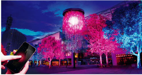
스마트폰을 사용하여 테마 플라워인 벚꽃·튤립·장미의 디지털 불꽃놀이를 통해 빛의 아트 공간으로