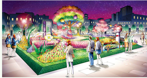
심벌 캐릭터인 가든 베어를 모티프로 한 페어의 심벌 가든. 빛이 닿으면 환상적인 분위기로