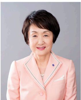
요코하마시장 하야시 후미코

2017 년도는 ‘요코하마시 중기 4 개년 계획 2014~2017’ 의 총 마무리 해입니다. 요코하마의 ‘지금’ 을 유지하고 ‘장래’ 에 걸쳐 발전시키기 위한 시책을 육아·교육, 복지·의료, 방재·감재, 경제 활성화에서부터 도시 조성까지 모든 분야에 걸쳐 추진하며, 중기 4 개년 계획의 목표 달성을 위해 재차 전력으로 임하겠습니다. 또한 집단 따돌림 문제와 통학로 안전 대책, 어린이 빈곤 대책 등 시급한 과제에 제대로 대응하고, 중기 4 개년 계획 이후를 내다본 시책도 추진하겠습니다.