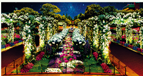
장미의 아치가 빛의 터널로. 화초는 빛의 융단으로