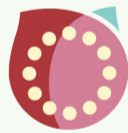
Garden Necklace YOKOHAMA 2017