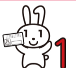
마이넘버 캐릭터 마이낭장