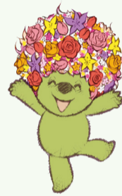
심벌 캐릭터 '가든 베어'