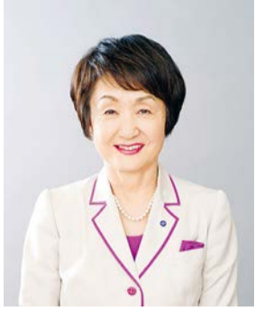
요코하마시장 하야시 후미코

93년 전에 요코하마의 도시를 덮친 칸토 대지진. 지금도 재건을 위해 매일 필사적인 노력이 계속되고 있는 동일본 대지진, 그리고 쿠마모토 지진. 여러 재해로부터 우리는 많은 것을 배우고, 충실하게 대비해 왔습니다. 요코하마시도 방재 계획의 수정, 해일 경보 전달 시스템의 도입, 감진 차단기 설치 보조 등 재해 대비에 만전을 기하고 있는 상황입니다.