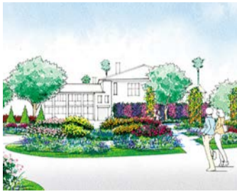
미나토노미에루오카 공원 이미지

행사장 사토야마 가든 '녹음이 풍부한 요코하마' 장소 : 요코하마 동물의 숲 공원 식물 공원 예정지 (요코하마 동물원 주라시아에 인접)