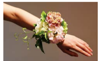
손목을 장식하는 리스틀릿을 만듭니다