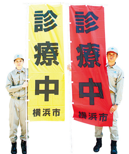
표식은 장대 깃발