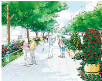
니혼 오오도오리 이미지

튤립이나 장미를 중심으로 니혼 오오도오리를 꽃으로 물들입니다. 또한 미나토노미에루오카 공원의 로즈 가든에서는 1,200 그루의 잉글리쉬 로즈와 은색이나 파란색의 일년초·속근초를 즐길 수 있습니다.