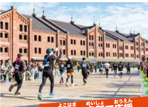
横浜の名所で応援