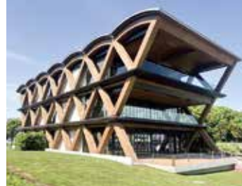
よこはま 横浜ティンバーーフ

秋には、木のぬくもりが感じられる新しい場所ができます。カフェでおいしいパンを食べながらのんびり過ごせます。2026年には、着替えてランニングに出かけられるようになるなど、それぞれの時間が過ごせます。