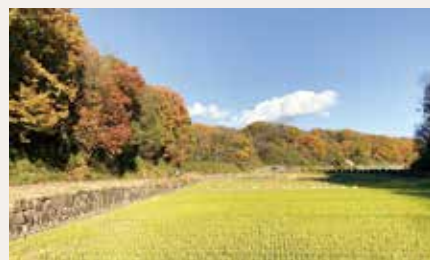
▲秋空の下、彩りに包まれて

季節によって違う様子の林や田んぼが見られ、鳥の鳴き声が聞こえる「寺家ふるさと村の森」、水車小屋や横浜市ではめずらしい農業用の池など、見るどころがたくさんあります。地元の農家が育てた、新鮮な野菜も売っています。