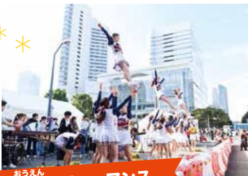
応援パフォーマンス