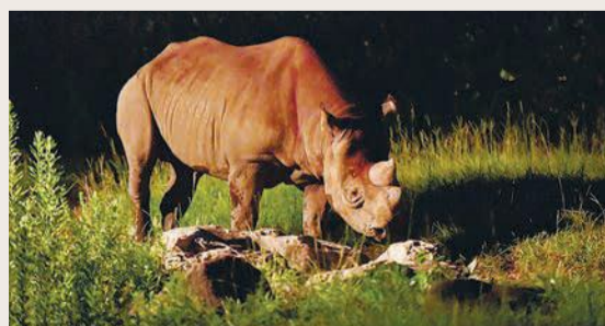
▲去年のナイトズーラシアのようす

よこはま動物園ズーラシアは、三保・新治地区にあります。1999年4月に開園しました。三保・新治地区は、横浜市が計画的に緑をまもっていくために決めた「緑の七大拠点」のひとつです。動物園の中にある「自然体験林」