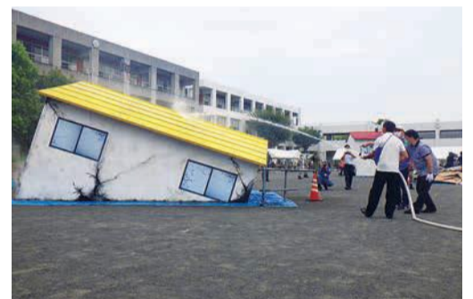
▲消防と市民による実動訓練のようす

【きくところ】総務局緊急対策課 TEL:045-671-2064 FAX:045-641-1677