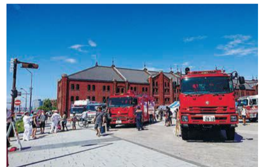
▲赤レンガ倉庫で行った防災フェアのようす

【きくところ】総務局地域防災課 TEL:045-671-3456 FAX:045-641-1677