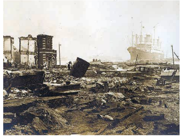
▲関東大震災の後の横浜港のあたり