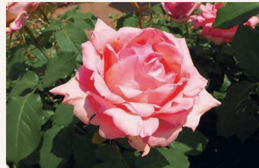
▲明るいサーモンピンクの大輪でかおりがよい品種「はまみらい」

ても人気が高かったということです。開港記念日は「バラ祭」とも呼ばれ、バラ展、バラ行進、バラ賛歌などの行事も行われました。