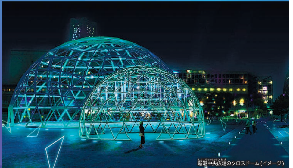
新港中央広場のクロスドーム(イメージ)