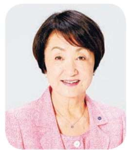
横浜市 市長 はやし ふみこ 林 文子

横浜市はこれまでに、合計6,000億円以上の「くらし・経済対策」を決めて、病院のうけ入れ体制や、感染症対策にとりくんできました。また市民や事業者のみなさんをたすけています。これからも対策を考えて、市民の安全・安心な暮らしをまもります。そして少しでも早く経済が元気になるようにします。