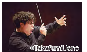
▲アンドレア・パッティストーニ