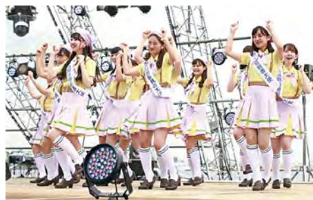
▲ 演っ娘 ☆スペシャルステージ