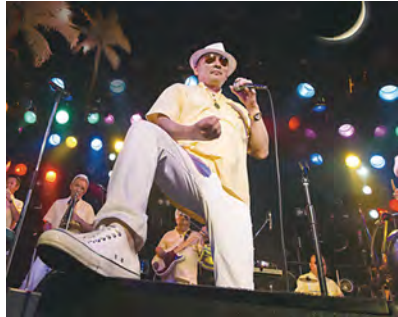
▲ CRAZY KEN BAND

5月3日(金よう・祝日)から6月2日(日よう)は、「横浜開港月間」です。横浜港の開港をお祝いする1か月です。山下公園を中心にして、横浜らしい国際的な感じのイベントがたくさん開かれます。メインイベントは「横浜セントラルタウンフェスティバル“Y160”」です。イベントに参加して、いっしょに楽しみましょう。