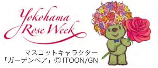
マスコットキャラクター 「ガーデンベア」 © ITOON/GN

開港からずっと、市民はバラの花にしたしんできました。そのバラを主役にして、新しいイベント「横浜ローズウィーク」が開かれます。横浜開港月間に合わせて、メインイベントの「ばらフェスタ 2019」をはじめ、さまざまなイベントが行われます。開港の歴史を感じる港の風景とバラをいっしょに楽しめます。またバラをテーマにしたスイーツなどを食べることもできます。