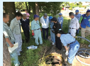
▲ 支援協力員、管工事協同組合、水道局での応急給水訓練の様子

令和7年度は168名が登録されており、地域における応急給水訓練等に参加し、災害時の「共助」の取り組みに貢献します。