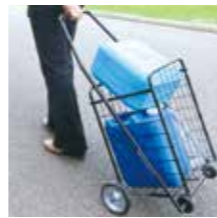
水が入ったポリ容器をカートで運ぶ

なお、災害時給水所には水を持ち帰るための容器はありません。ポリ容器などの水を入れる容器とカートなどの運ぶ道具も事前に準備しましょう。