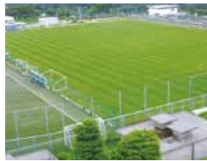
西谷浄水場3号配水池(保土ヶ谷区)

災害時には市民の皆さまに給水を行うほか、給水車への水の注水場所として活用します。市民の皆さまが必要とする飲料水1週間分に相当する水量を確保できます。