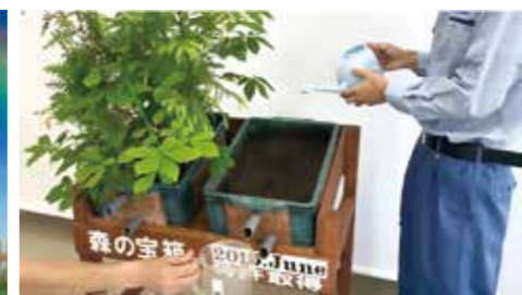
YouTubeで公開している動画