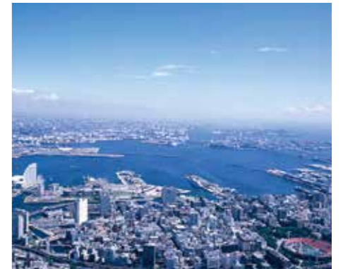
横浜港周辺の工業地帯

石油製品製造業、食料品・飲料製造業、鉄鋼業、化学工業、電気機械器具製造業、電気供給業など、様々な用途に工業用水が使われており、工業用水道事業は横浜の経済と市民の皆さまの暮らしを支える産業基盤としての役割を果たしています。