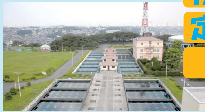
西谷浄水場ろ過池