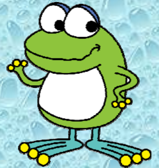
横浜市水道局キャラクター はまびオン