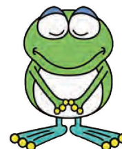
横浜市水道局キャラクター「はまビョン」