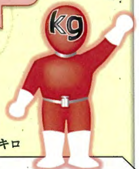
SI 戦隊ハカルンジャー・キロ