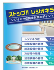
○啓発パンフレット

令和5年度に国内で冷却塔を原因とする大規模な集団感染事例が発生し、本市においても冷却塔におけるレジオネラ属菌の指針値超過により、施設運営に影響を及ぼす事例が発生していることから、改めて適切な維持管理について指導・啓発を行います。