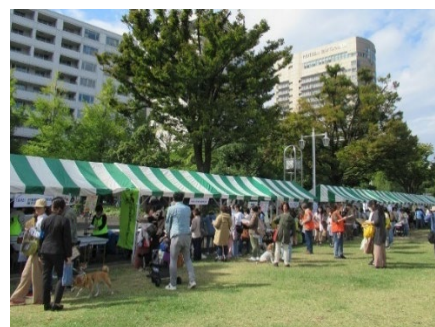
【動物愛護フェスタよこはま】

動物愛護フェスタよこはま実行委員会と横浜市医療局の共催により、動物の愛護と適正飼育についての関心と理解を深めるためのイベントとして、ブース出展やデモンストレーションを実施します。