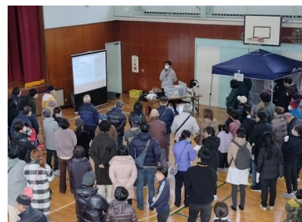
【適正飼育の啓発事業】

各区福祉保健センターでは、猫の屋内飼育や犬猫の健康管理等のセミナー、災害時のペット対策啓発などの取組みを行い、適正飼育の重要性や終生飼育について周知・啓発を行います。また、小中学校での講義等、動物愛護の啓発事業を実施します。