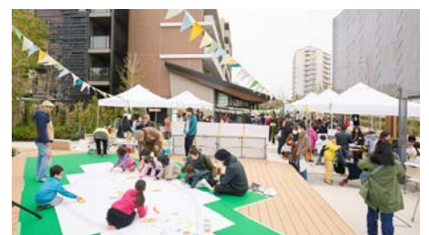
イベント当日写真