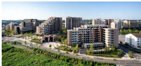
▲20街区全体写真 2019年9月撮影

今後も横浜市と本事業者は、十日市場町および周辺地域の住民などと連携し、プロジェクトやエリアマネジメントを通じて魅力ある十日市場ブランドの創造や、周辺地域の価値向上、街のさらなる活性化を図っていきます。